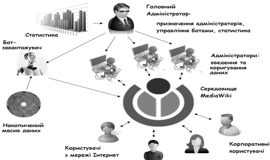
Рис. 2 – Схема організації колективної роботи

Можливості технології MediaWiki дозволяють організувати колективну роботу по веденню/супроводженню ЕлЕнЗ у модернованому режимі (Рис. 2).